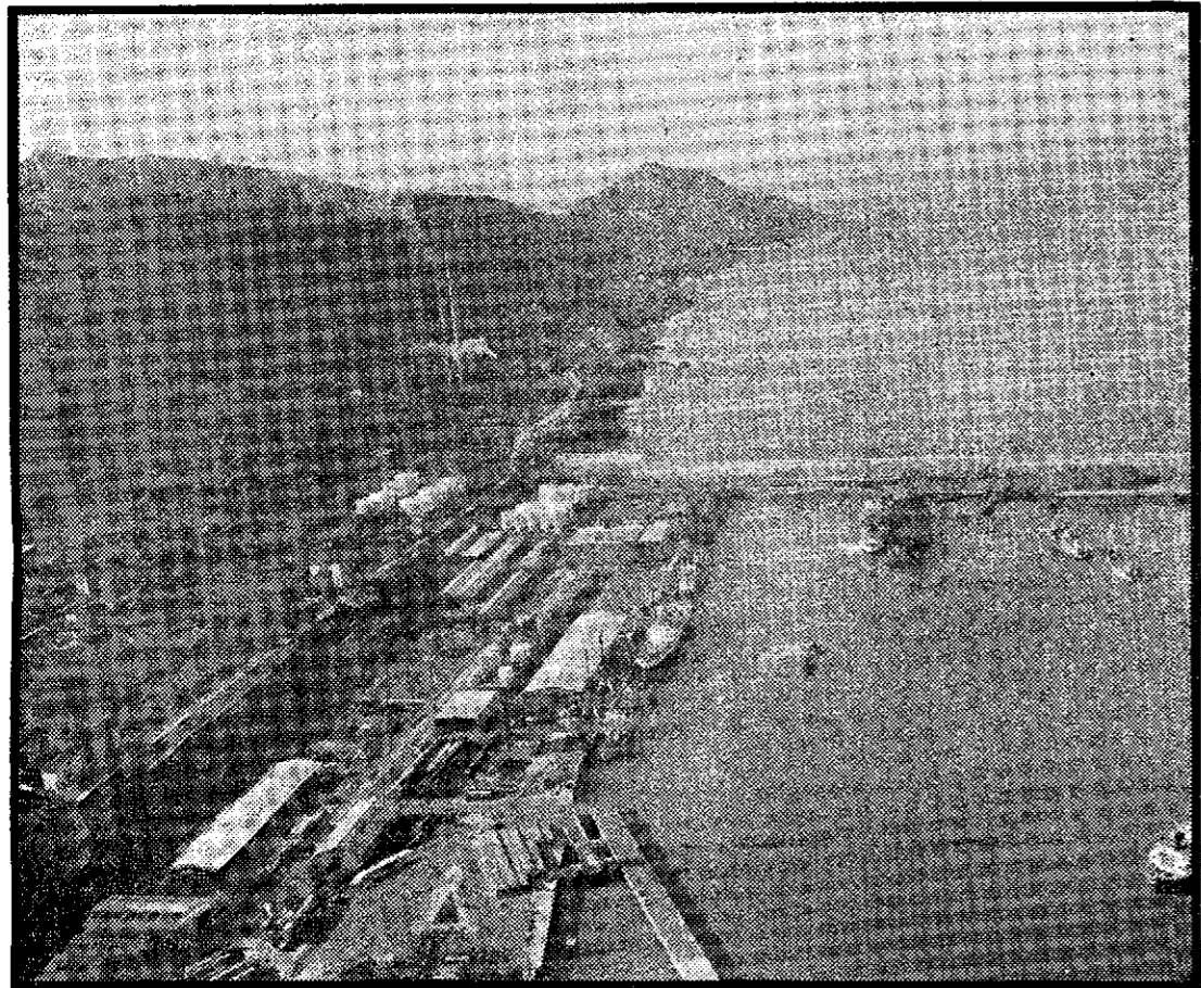
Muelle Reina Victoria y Pantalán de Petróleos. Bilbao.

Los transportes por mar nunca tuvieron competencia. Los terrestres, tanto carretera como ferrocarril, han seguido una línea de superación, hasta su excelencia actual, pero su obligado avance francés los sujeta a incidencias y condicionamientos que no tienen los marítimos, totalmente autónomos, y que, por añadidura, siguen siendo los más económicos en embarques de cierta entidad.