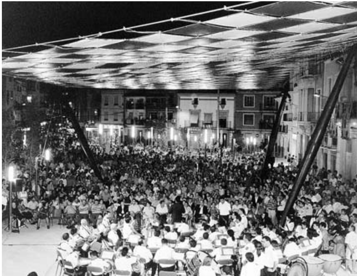
CONCIERTO OFRECIDO POR LA ASOCIACIÓN BANDA DE MÚSICA CALASPARRA.

Un poco más tarde, a las 22.30 horas se dará paso a una proyección cinematográfica en el cine