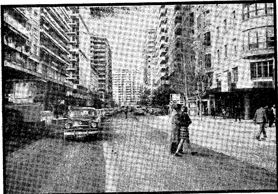
Operación asfalto en la Gran Vía de José Antonio.

Hoy los tiempos avanzan... Y es posible asfaltar toda una Gran Vía de José Antonio sin tener que interrumpir, por ello, el tráfico rodado. Los guardias municipales hicieron un esfuerzo. Los conductores ejercitaron más espacio. Los peatones soportaron alguna pequeña molestia. Y la avenida quedará flamante para que sobre ella pasen las carrozas y los hombres de a pie durante las Fiestas de Primavera. Caminarán más seguros los estantes, con los pasos sobre los hombros, durante las procesiones de la Semana Santa. Sea bienvenido el asfalto a la Gran Vía, aunque hayan otras calles que lo recibirían con interminables aplausos.