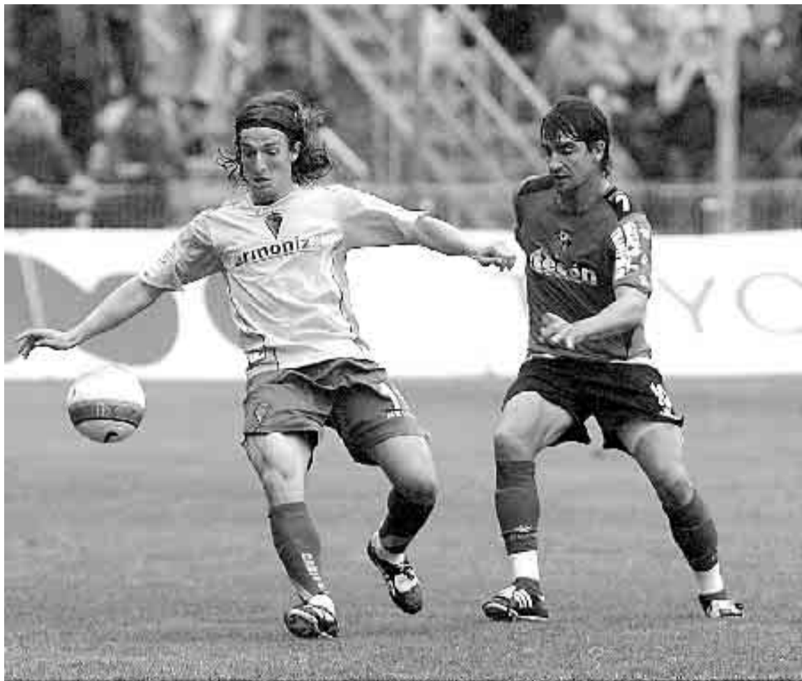
RAMÓN DE CARRANZA. Un jugador del Cádiz y el rojillo Torrecilla pugnan por el balón.

Tiene razón el letrado, ferviente seguidor del Real Murcia con las prisas de quien aún vestía pantalones cortos, que el Murciano sólo es el rey de Segunda en número de temporadas, de victorias, de puntos y de goles, sino también de ascensos por vía de campeonato, incluso en aquellos tiempos en que la división de plata andaba partido en dos grupos, con premio directo para los respectivos campeones y el honor de cam-