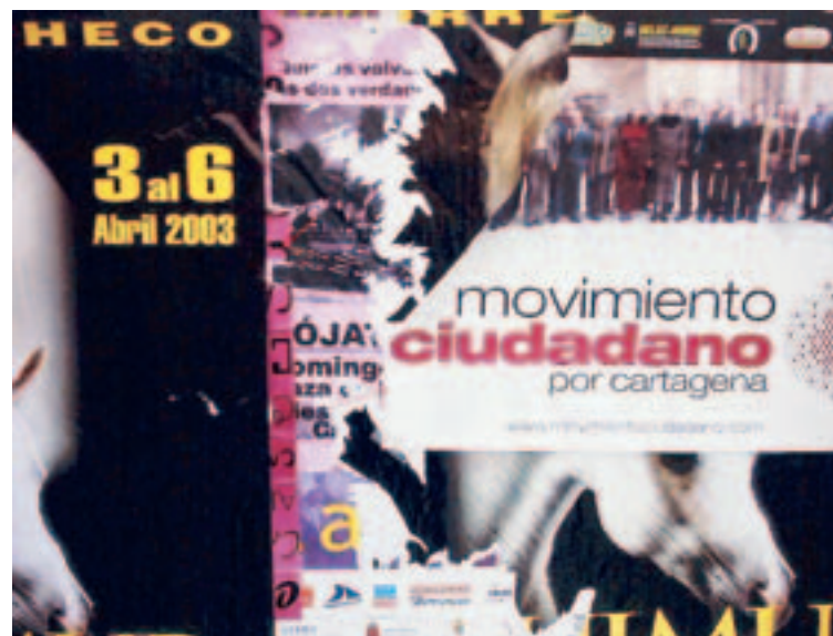
CARTELES. Papel tapando papel. El MC se disculpó ayer.

Según Martínez Carrión la situación del Cartagonova les preocupa profundamente y están estudiando la manera de buscar soluciones desde la política, por lo que les gustaría tener un encuentro con la misma plataforma.