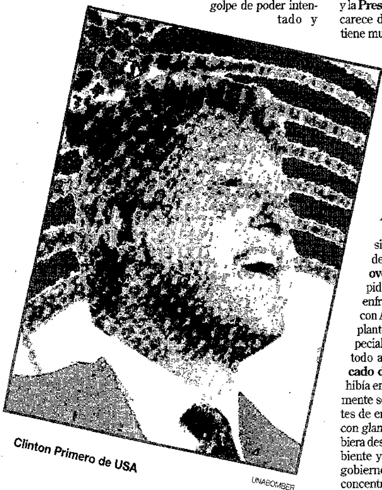
Clinton Primero de USA

Bueno, pues esa es la pregunta para el ciudadano de a pie.