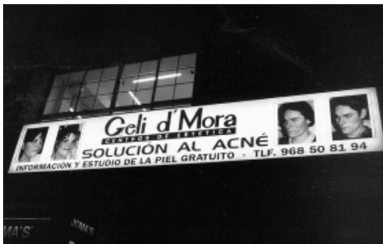
Fachada de Geli D'Mora en Alfonso XIII.