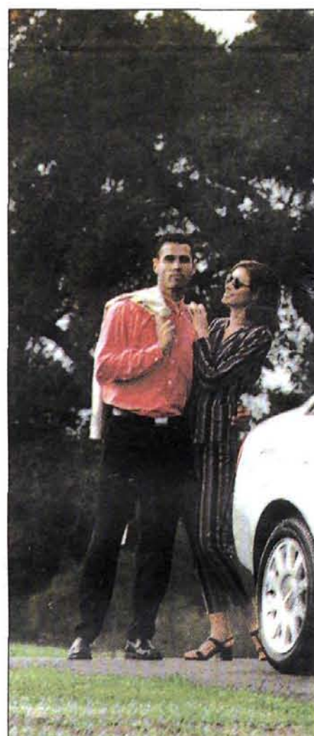
El nuevo «A6» tiene una imagen vanguardista.

Esta versión disfruta de un gran confort de marcha y el motor se muestra muy suave, especialmente si se conduce cambiando sobre las 3.000 r.p.m., lo que proporciona un buen nivel de prestaciones. Si se apuran las velocidades pisando a fondo hasta las 4.500 r.p.m., las aceleraciones son increíbles para un motor diesel, y el nivel de prestaciones soberbio, sobrepasando con facilidad la barrera de los 200.