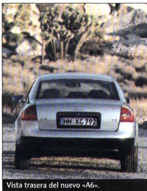
Vista trasera del nuevo «A6».

Audi ha sido la marca pionera en la tecnología de motores turbodiesel de inyección directa para turismos, dotándoles de un turbocompresor de geometría variable que proporciona una prestaciones y unos consumos increíbles. La última realización en este campo es el V6 de 2,5 litros que montan «A8» y «A6».