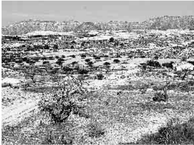
VERTEDERO. Vista de la zona donde se quiere instalar.