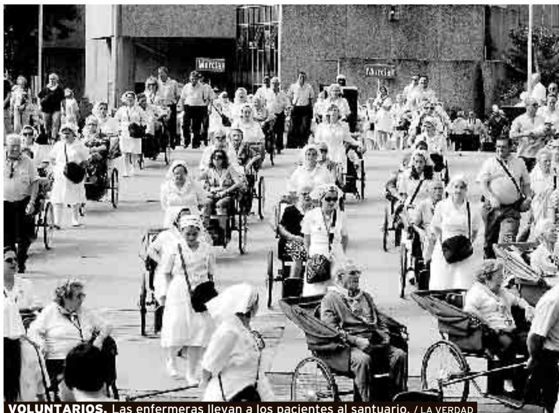
VOLUNTARIOS. Las enfermeras llevan a los pacientes al santuario.