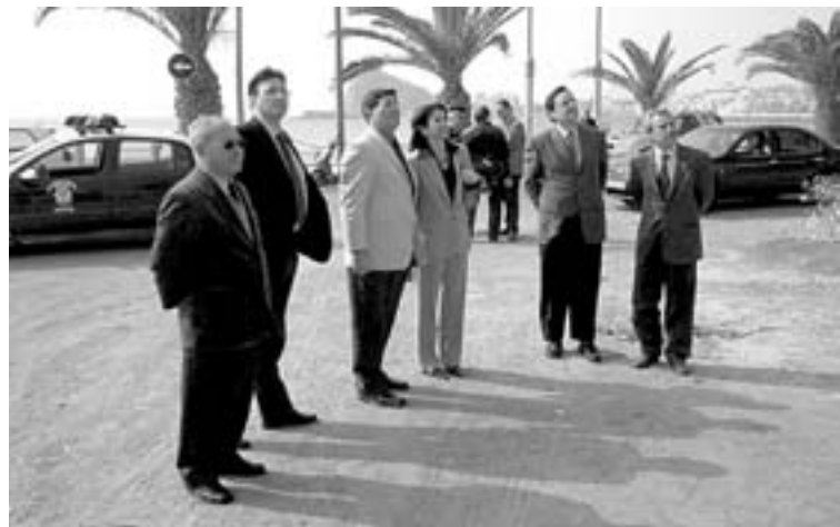
EN EL SOLAR. Las autoridades visitando los terrenos, ayer.

La consejera de Hacienda añadió que la construcción del nuevo auditorio y palacio de congresos «contribuirá a ampliar la oferta de servicios del municipio, lo que, unido al desarrollo del turismo de calidad, complementará las infraestructuras que demandan los ciudadanos de Águilas».