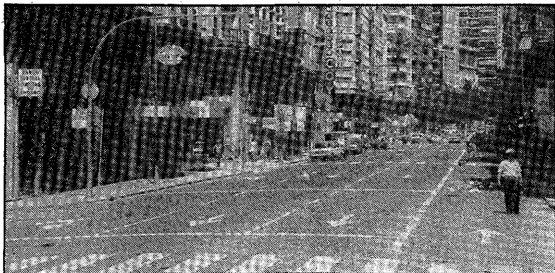
La actualización del catastro ha asustado a los ciudadanos.