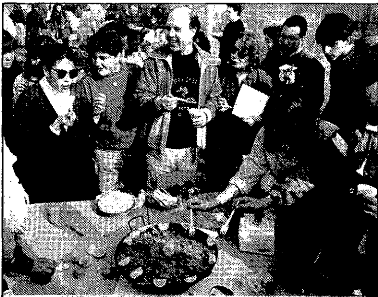
Formación y gastronomía. Cultura y gastronomía se fundieron ayer en el Politécnico Ramón y Cajal de Murcia, con motivo de la festividad de San Juan Bosco. Entre los actos, destacó el simpático concurso de paellas. Gran participación y buen humor. Suponemos también buen apetito.