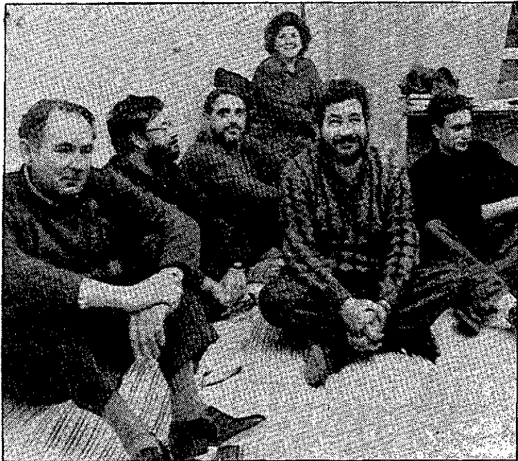
Los concejales llevaron sacos de dormir para pasar la noche.