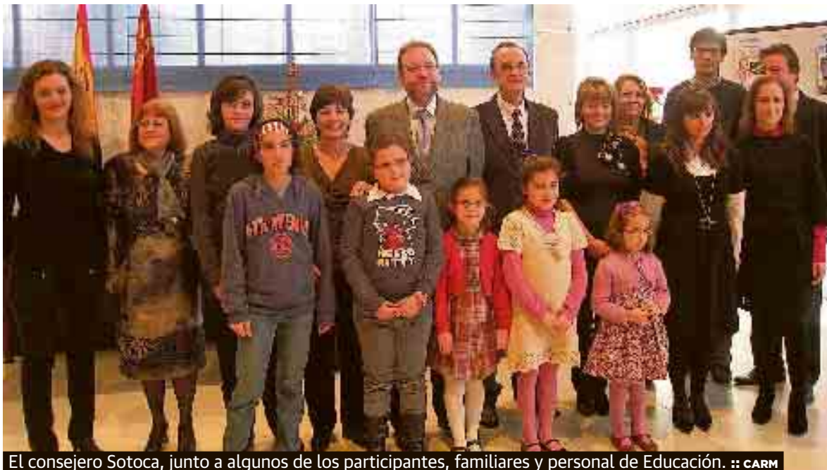
El consejero Sotoca, junto a algunos de los participantes, familiares y personal de Educación.

El consejero de Educación, Constantino Sotoca, entregó ayer los primeros premios 'Alumnos Región de Murcia: Mi Maestro', convocados por su departamento para promover el reconocimiento de la figura del docente, y en los que han participado 5.500 alumnos de más de un centenar de centros. El objetivo del concurso es difundir entre los escolares valores de reconocimiento a la figura del docente, propiciar un buen clima entre maestros y alumnos, y reconocer la creatividad de los alumnos.