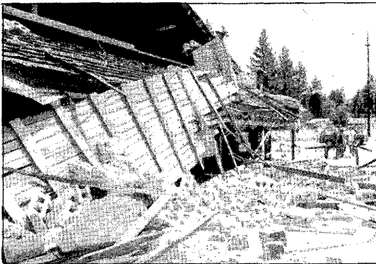
Numerosos edificios quedaron destruidos tras el seísmo del domingo.

Testigos presenciales aseguraron que ambas sacudidas hicieron moverse los rascacielos del centro de Los Angeles, pero, aparentemente, no causaron víctimas, ni grandes daños materiales. Estos dos fuertes movimientos telúricos, consecuencia de los dos terremotos del domingo de unas magnitudes de 7,4 y 6,5 en la escala Richter, fueron precedidos de una serie de sacudi-