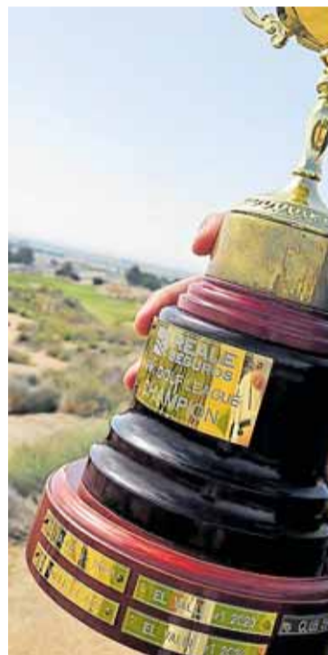
En la peana se lee el nombre de la 'society' ganadora cada año.