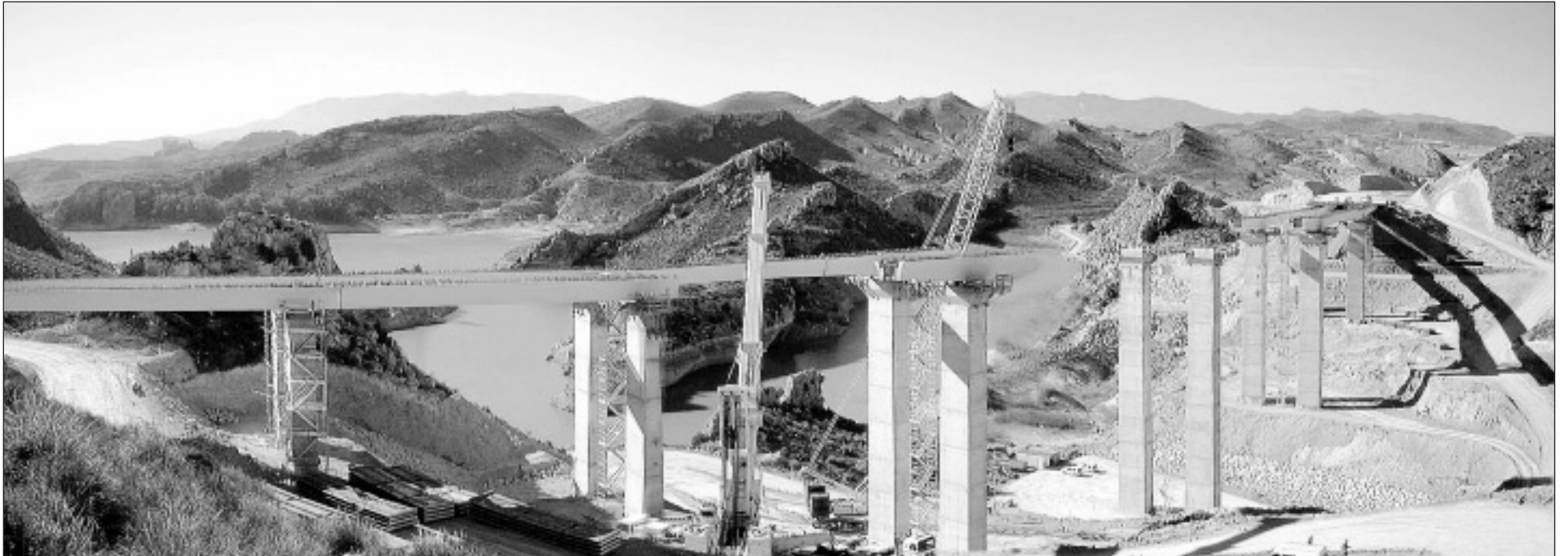
Imagen de las obras del viaducto que bordea el embalse de La Cierva.