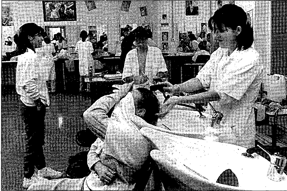
Alumnos de Formación Profesional de un instituto de Murcia.

El Ministerio, que tiene implantadas en la Región cinco titulaciones de FP superior, pondrá en marcha el próximo curso otras seis de nueva creación. Las de nueva creación