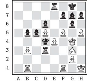
Partida: Huss-Pokoevchuk (Olimpiada de Malta, 1980).