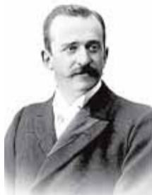
El Conde de Romanones