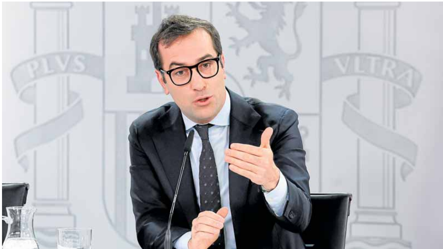
El ministro de Economía, Carlos Cuerpo, durante su comparecencia ayer, tras el Consejo de Ministros.

Economía plantea un límite del 4% mensual para los préstamos rápidos y, hasta que se apruebe la norma, uno temporal del 22% para las 'tarjetas revolving'