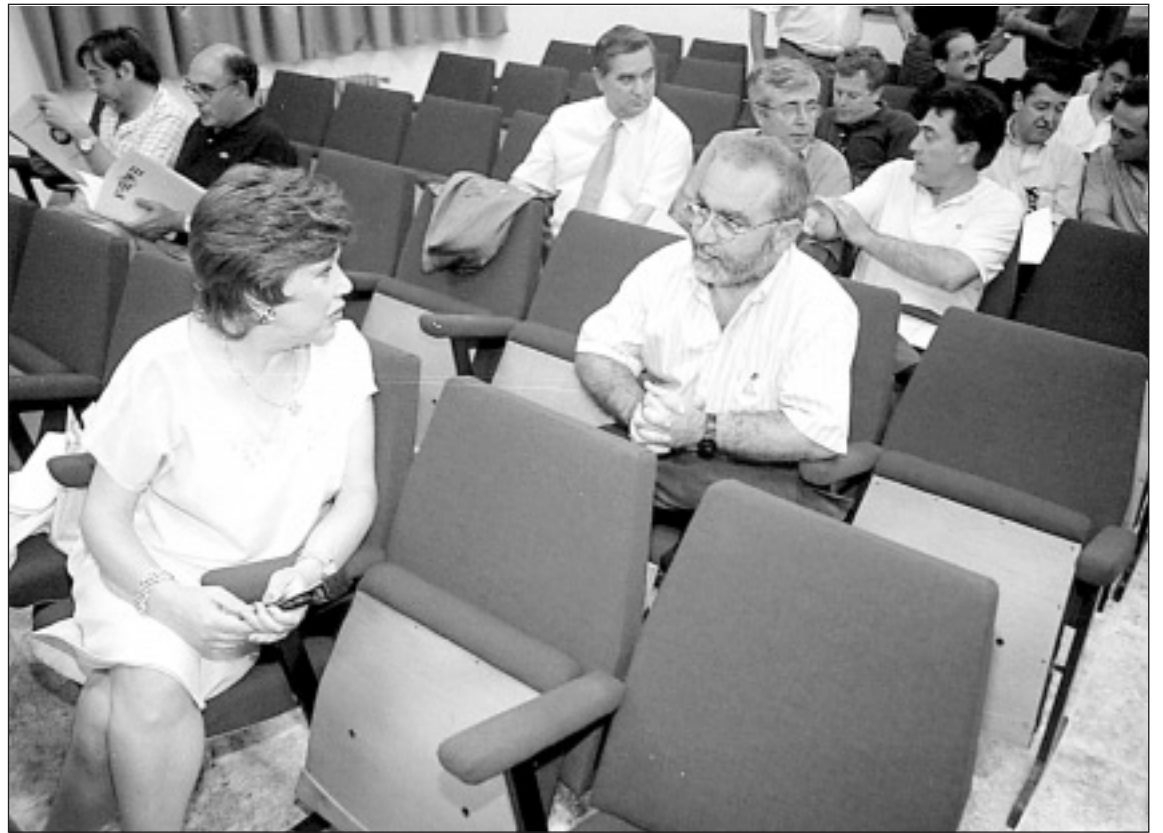
Un momento de la reunión convocada el miércoles por Renfe.

El presidente del Foro valoró muy positivamente esta quinta reunión anual del organismo, ya que «ha servido para consolidar el trabajo que desarrollan los más de cien miembros que la integran en la mejora de la gestión de los recursos pesqueros».