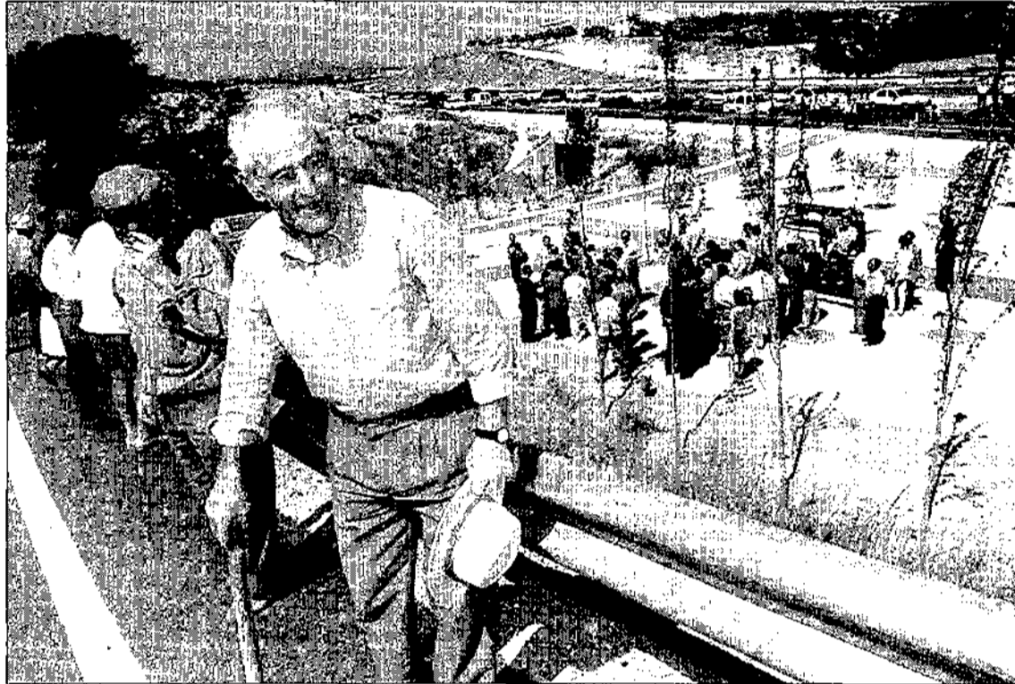
Vecinos de Chirivel, sobre el arcén del nuevo tramo de autovía inaugurado ayer.

El consejero de Obras Públicas y Transportes añadió que «no existe voluntad inversora por parte del ministerio para restablecer la línea de ferrocarril». Insistió en que, en este momento, «las comunidades autónomas sin compe-