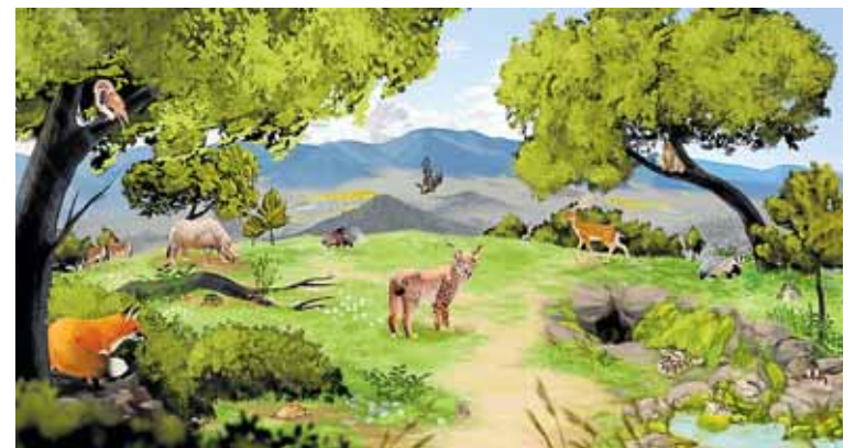
Ilustración que recrea el entorno del yacimiento de Quibas durante la formación del nivel glaciar (QS-2/3), hace un millón de años. NÚRIA MALO

La sima se abrirá a las visitas en 2026, con seguridad y desde dentro, y este otoño ya se podrán ver dos réplicas del lince