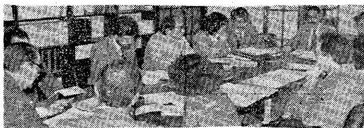
Un momento de la reunión que ayer mantuvo el comité de seguimiento de la encuesta.

empresa murciana, que desde octubre pasado viene realizando la empresa consultora «Sofemasa», a requerimiento del INDEMUR (Instituto de Desarrollo Regional), que, a su vez, recibió el encargo de la CROEM (Confederación Regional de Organizaciones Empresariales).