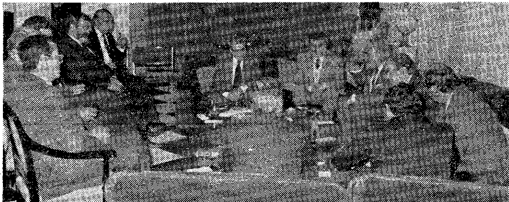
El presidente de la Generalidad de Cataluña, Jordi Pujol, durante la entrevista que mantuvo el pasado fin de semana con los directores de los medios de comunicación de Murcia.

Según declaró personalmente el nonorable Jordi Pujol, presidente de la Generalidad de Cataluña, tanto él como su partido político —«Convergencia i Unió»— están dispuestos a apoyar cuantas gestiones sean necesarias para la construcción de la autopista Alicante-Murcia, tanto desde el plano institucional como en el Congreso y ante el Gobierno de UCD. El presidente Pujol hizo estas declaraciones en el curso de un almuerzo con los directores de los medios informativos de Murcia celebrado el pasado fin de semana en su residencia particular del Palacio de San Jordi, con motivo de su próxima visita a nuestra región los días