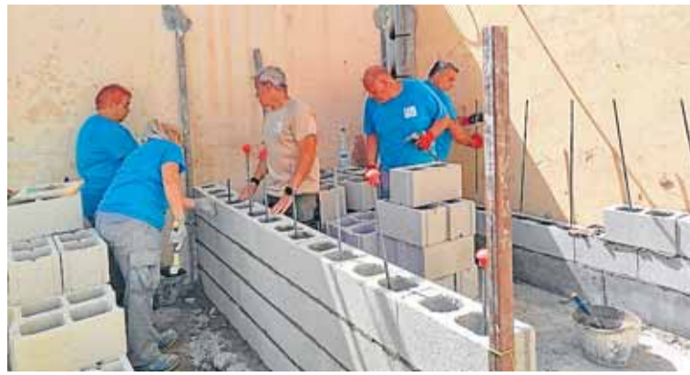
Un grupo de operarios levantan los muros para los toros. ÁNGELA BELMAR

de los festejos taurinos que tienen lugar en agosto. La construcción de estos espacios para las reses permitirá que los festejos se desarrollen con todas las garantías y con plena normalidad, facilitando el manejo de los novillos y evitando contratiempos. Con ello, se refuerza la tradición y el arraigo de la cultura taurina en Blanca. Las tareas están siendo llevadas a cabo por los alumnos del programa Blanca Emplea, de la modalidad