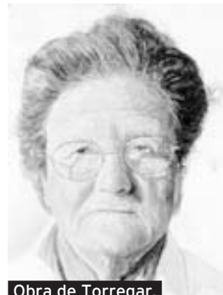
Obra de Torregar.

Biblioteca Municipal de Mula. Hasta el 24 de abril.