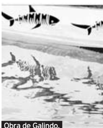
Obra de Galindo.

Museo Siyasa. Cieza. Hasta el 2 de mayo.