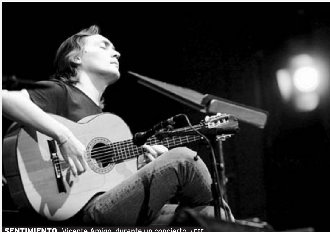
SENTIMIENTO. Vicente Amigo, durante un concierto.