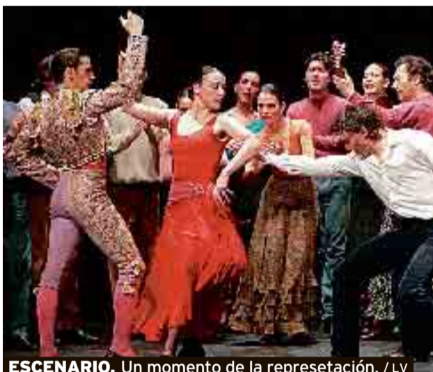
ESCENARIO. Un momento de la representación. / LV

El medium, de color ámbar, se comparte con los patés y los quiches; por su parte, el cream, por su cuerpo y dulzor, es el idóneo para la repostería. El Pedro Ximénez, tan consumido en estos últimos años, es un complemento para los helados, los quesos azules y todo tipo de repostería, pero no es el más apropiado para el foie. / J. M. GALIANA