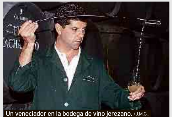
Un veneciador en la bodega de vino jerezano.