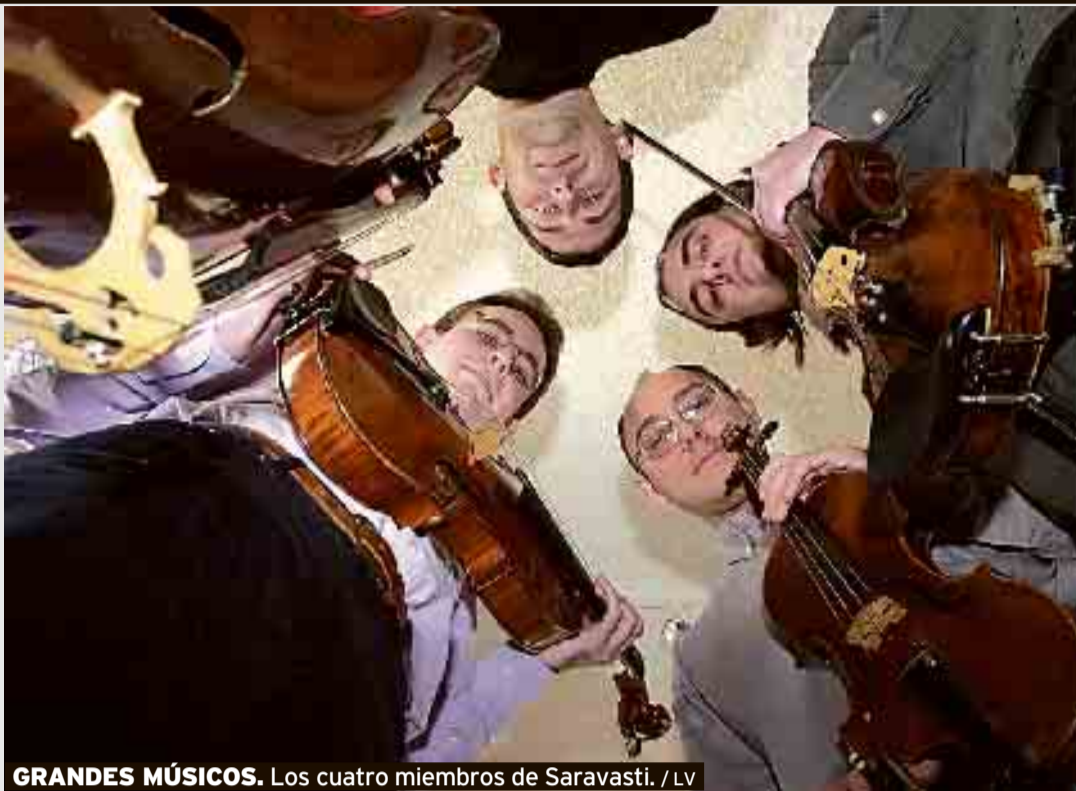
GRANDES MÚSICOS. Los cuatro miembros de Saravasti.