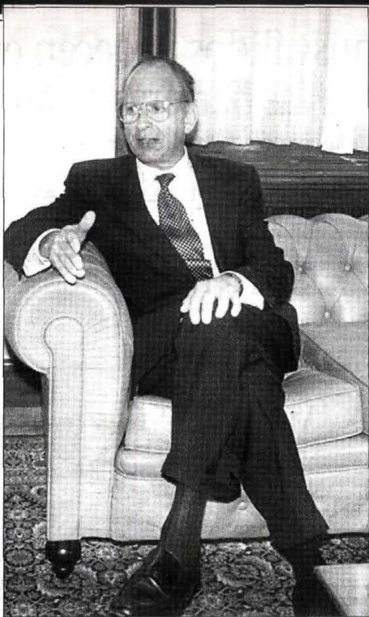
El embajador de Estados Unidos en España, ayer, en San Esteban.

R. Sé que proyectan una importante ampliación, pero no sé en qué fechas determinadas. Además de este tema he tratado con la Presidenta la posibilidad de otras inversiones, aunque aún no