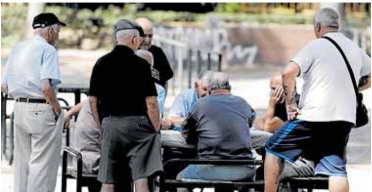
Un grupo de pensionistas juega al dominó en un parque. R. C.

MADRID. El Gobierno elevó hace un par de semanas al 2,7% su previsión de crecimiento de la economía para 2025, una décima más que en su último cuadro macroeconómico. Hasta ese momento todas las casas de análisis daban una estimación inferior en dos o tres décimas a la del Ejecutivo, que llegó a asegurar incluso que era un cálculo «prudente» dado el buen ritmo del consumo y del mercado laboral. Ahora se encuentra un aliado inesperado que supera incluso su optimismo: el Consejo General de Economistas (CGE) publicó ayer su nueva estimación para 2025 en la que dispara cuatro décimas su previsión hasta el 3%. Los economistas indican, en un comunicado, que el dinamismo de la demanda interna y del mercado de trabajo son los que están motivando este incremento de la economía, además de la actualización de la Contabilidad Nacional realizada por el INE hace unos días. En este sentido, el CGE considera que la buena evolución de las cifras de empleo hasta septiembre lleva a revisar a la baja la tasa de paro hasta el 10,5%, tres décimas menos que la estimación anterior. Eso sí, los economistas también revisan al alza la tasa de inflación prevista para este año. En concreto, la aumentan dos décimas hasta cerrar el año con un IPC medio del 2,6%, medio punto por encima del objetivo de precios marcado por el Banco Central Europeo (BCE).