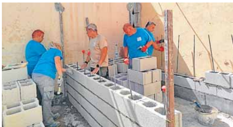
Un grupo de operarios levantan los muros para los toros. ÁNGELA BELMAR

de los festejos taurinos que tienen lugar en agosto. La construcción de estos espacios para las reses permitirá que los festejos se desarrollen con todas las garantías y con plena normalidad, facilitando el manejo de los novillos y evitando contratiempos. Con ello, se refuerza la tradición y el arraigo de la cultura taurina en Blanca. Las tareas están siendo llevadas a cabo por los alumnos del programa Blanca Emplea, de la modalidad