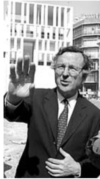
Rafael Moneo.

(«Conduce a un mundo de gaudules»). Tiene Álvarez en su casa un escudo alemán del siglo XV que reza: «Si no te gusta esto,