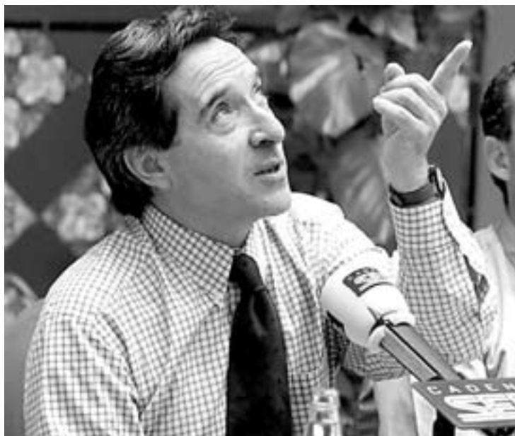
ACONTECIMIENTO INÉDITO. Iñaki Gabilondo.

zález, Memorias del futuro . En el, el ex presidente del Gobierno español aborda cuestiones como la globalización y la situación política mundial. Este argumento servirá para que los invitados expresen sus opiniones sobre cuestiones de actualidad como la guerra en Irak tras el 11-S, la globalización o las relaciones entre Europa y América.