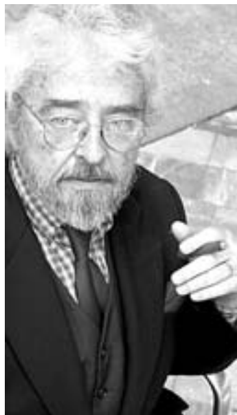
José María Álvarez.