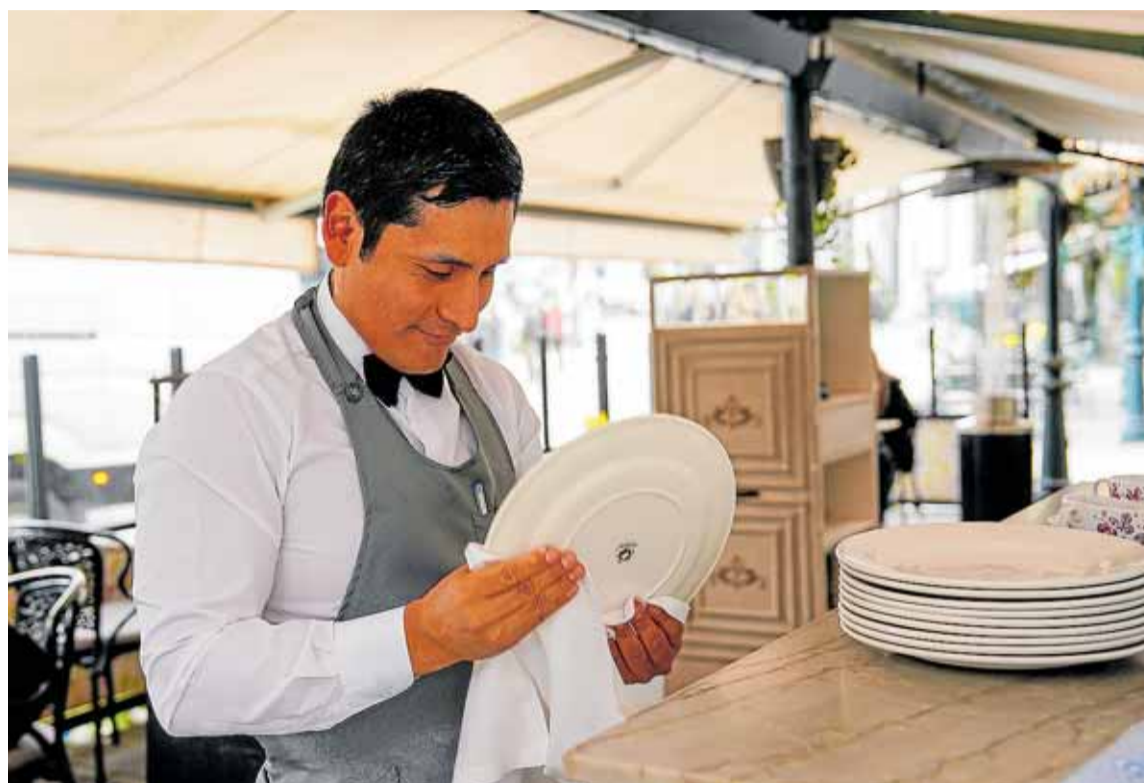
Un camarero, durante su trabajo en una terraza.

Este incremento se sumará a las alzas acumuladas del 61% desde que Pedro Sánchez llegó a Moncloa en 2018. Aunque Trabajo no está obligado a negociar el incremento del SMI –sí a realizar consultas–, suele tratar de llegar a un acuerdo con los agentes sociales, que son quienes de-