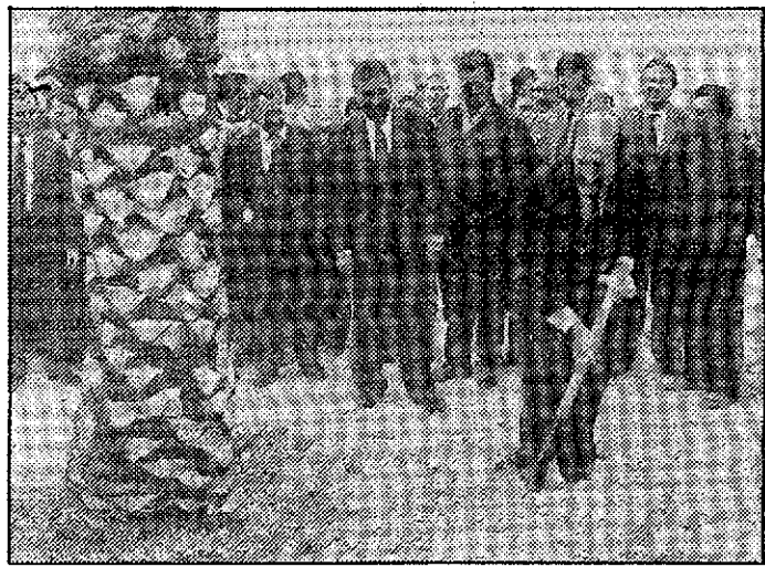
El ministro plantó dos palmeras.

El Plan Hidrológico Nacional se habrá redactado en la primera mitad de la legislatura. El ministro señaló ayer que ya había sido enviada la documentación básica para acometer esa redacción y que los organismos de las cuencas se encontraban ya en condiciones de remitir sus propuestas. No quiso especificar qué tipo de actuaciones habrá en el Plan pero recaló que se haría para