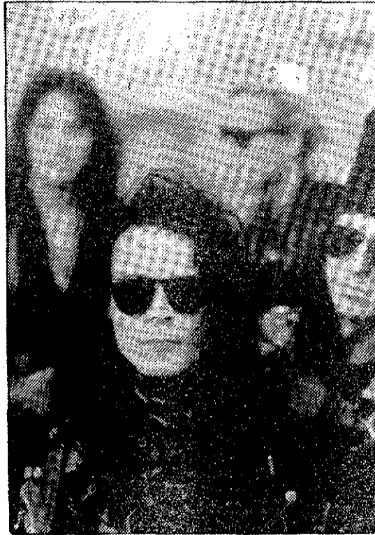
LA VERDAD Música 'diabólica', esta noche en 'El Limite'.

A mediados de los 80, y tras lanzar More , estrenan su primera formación seria; pues los continuos cambios de sus componentes le imposibilitaba para