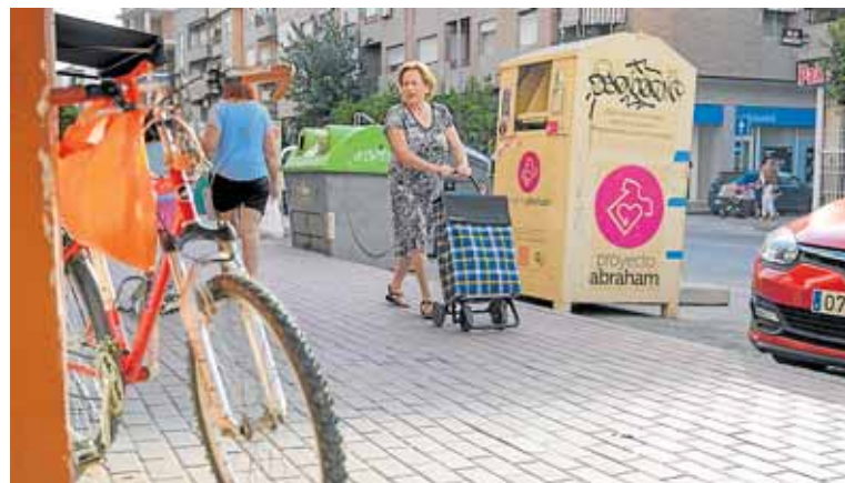
Contenedor donde fue hallado el fallecido.

cuerpo dentro de un contenedor en la calle Mayor de Puente Tocinos, indicando además que unos vecinos habían intentado extraerlo sin éxito. Una ambulancia con personal sanitario de la Gerencia de Urgencias y Emergencias Sanitarias 061 (UME) se desplazó al lugar. A su llegada, solo pudieron certificar el fallecimiento.