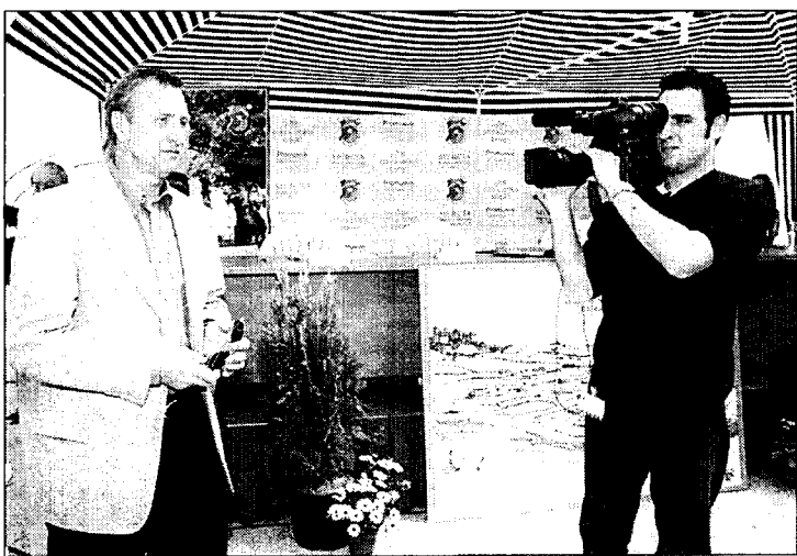
Cruyff visitó la semana pasada la urbanización.