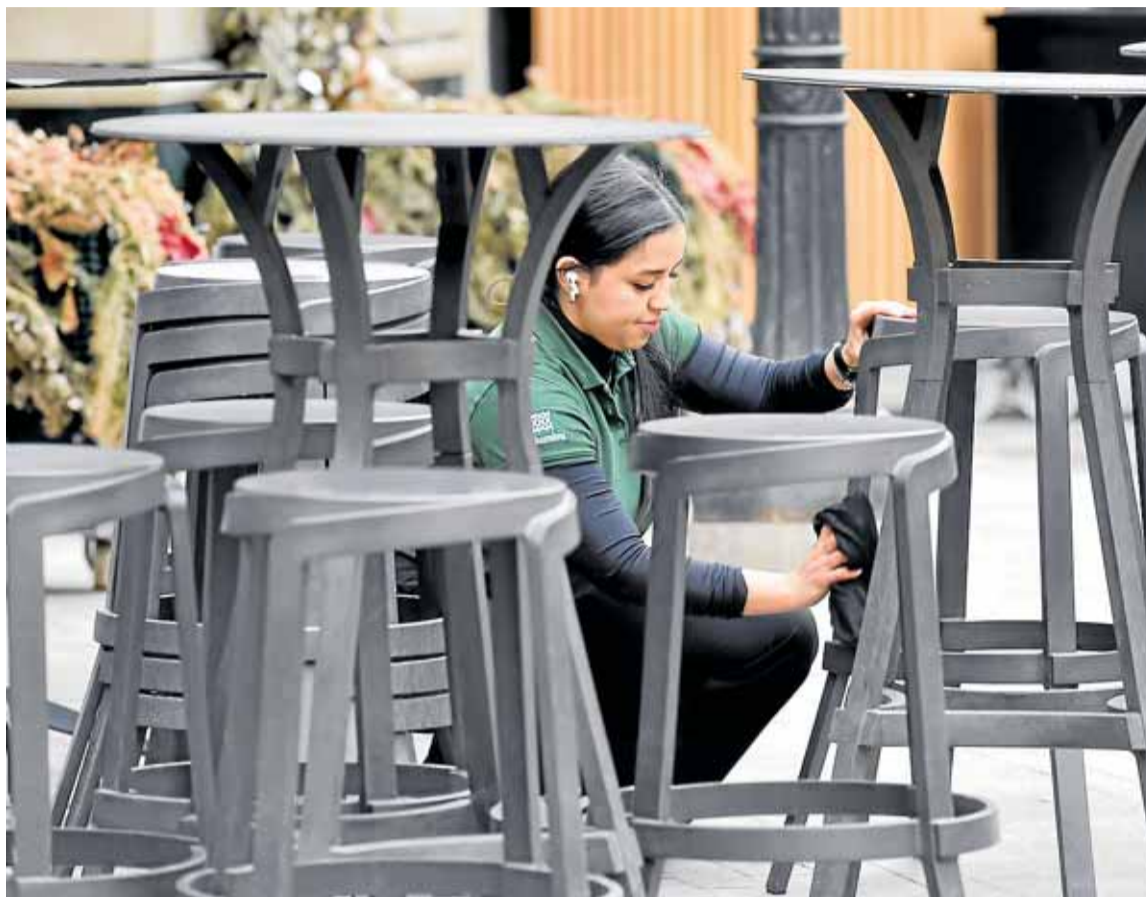
Una trabajadora prepara la terraza de un local de hostelería en Murcia.

Como consecuencia de esta evolución, el gasto para las empresas en el conjunto del Estado es un 13,9% superior que el registrado en el ámbito regional. Y el factor determinante para que se produzca esa diferencia en el coste laboral tiene que ver con el componente salarial, que comprende salario base, complementos salariales, pagos por horas extraordinarias y otros extraordinarios y atrasados, medidos en términos brutos. Y es que en este caso, dicho coste conlleva un alza interanual del 1,5% en la Comunidad,