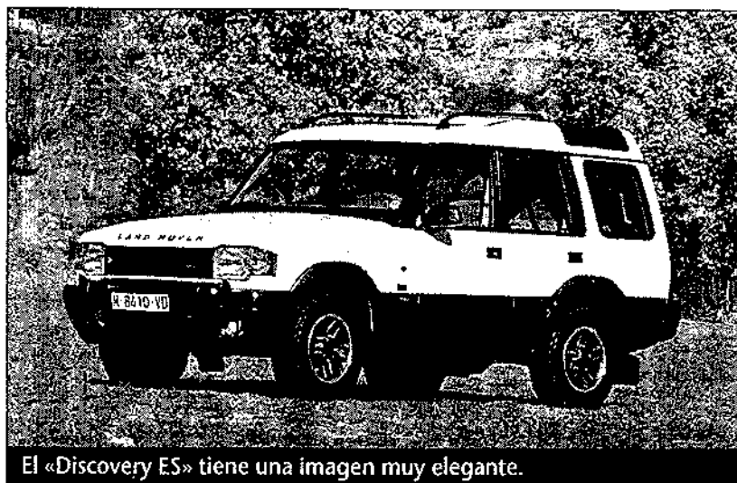
El «Discovery ES» tiene una imagen muy elegante.