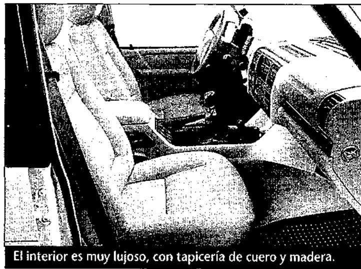
El interior es muy lujoso, con tapicería de cuero y madera.

sado, como el resto de la gama del modelo, por el conocido motor 300 Tdi, turbodiesel de inyección directa. Con 4 cilindros y una cilindrada de 2,5 litros, obtiene 112 CV a 4.000 r.p.m. y un par máximo de 265 Nm a 1.800 r.p.m.