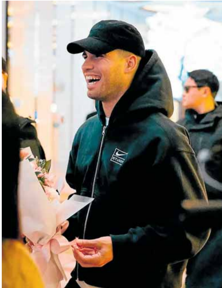
Carlos Alcaraz, ayer a su llegada al aeropuerto de Seúl.

Este viernes participará en la rueda de prensa oficial del evento y entrenará en el recinto en el que se disputará el encuentro frente a Sinner, el Inspire Arena, con capacidad para 15.000 es-