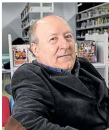
José Luis Villacañas, filósofo.