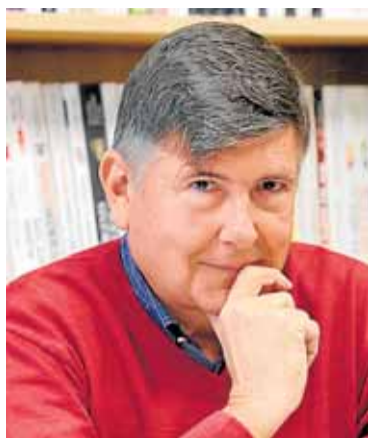
Manuel Pimentel, escritor, editor, y exministro de Trabajo.