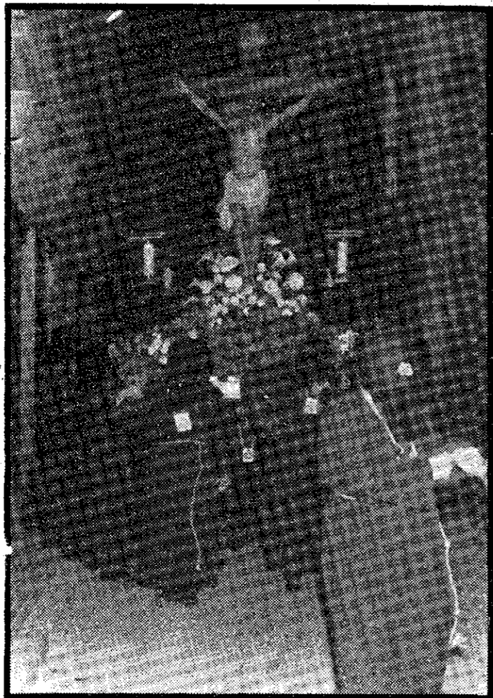
Procesión del Cristo del Socorro, la primera del año, que, precisamente tiene lugar hoy, Viernes de Dolores.

Uno, ya hacía tiempo que estaba pensando en lo que hubo y en lo que había —en lo que todavía hay, al parecer ya por poco tiempo— en aquellas ruinas. Me había faldado mi cartagenerismo. En contra de todo ese "volver a ser" de mis paisanos, la Catedral seguía mostrando al cielo sus tristes despojos. Amenazaba incluso con dejar caer lo que todavía se conservaba. Y entonces comprendí que "aquello" tenía, podía ser, una bella misión. Y aun sabiendo que era muy difícil, aun sabiendo que no contaba ni con capital ni con ayudas; aun teniendo en cuenta que la crítica, y no precisamente la "buena", nace a casa paso y en cualquier lugar, sin saber el motivo, el cómo ni el dónde, puse manos a la obra. Dejarme sentir, aun cuando sea un pecado pequeño, que sienta un poco de orgullo, al cumplirse hoy, 5 de abril de 1974, los catorce años de "mi" Cofradía del Cristo del Socorro. Y también el darte gracias a ti, Señor, por haber podido un año más, contemplar, emocionarme y sentirme abrumado, de esas miles de caras, de esos millares de semblantes que suben allí, hasta aquellas ruinas; sea cualquiera que fuere el tiempo que haga, para integrar una de las manifestaciones de más fe de nuestro pueblo que es, también, o al menos a mí me lo parece, un deseo de renovarse del espíritu: un volver a integrarnos todos en una bella y maravillosa tradición sobre las ruinas de la que fuera primera iglesia de España. Y eso que cuesta subir; que