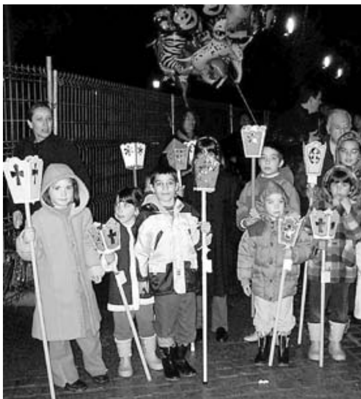
CON BOTAS Y CAPUCHAS. Los niños yeclano salieron en procesión aunque el itinerario se acortó por la lluvia.

Hoy, la 2 de TVE retransmite en directo, para el circuito regional, la Procesión de la Pasión del Señor. La retransmisión empieza a las 20 horas y se desarrollará hasta las 22 horas. El cortejo procesional se inicia a las 19.50 horas, desde la basílica de la Purísima. Un total de 16 pasos con sus respectivas cofradías las bandas de música y de cornetas y tambores configuran el desfile. La procesión sigue un orden cronológico de la Pasión, según relatan los evange-