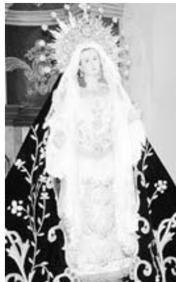
La Amargura estrena manto.

El horario de la procesión de Nuestro Padre Jesús Nazareno se iniciará a las 9.30 de la noche des-