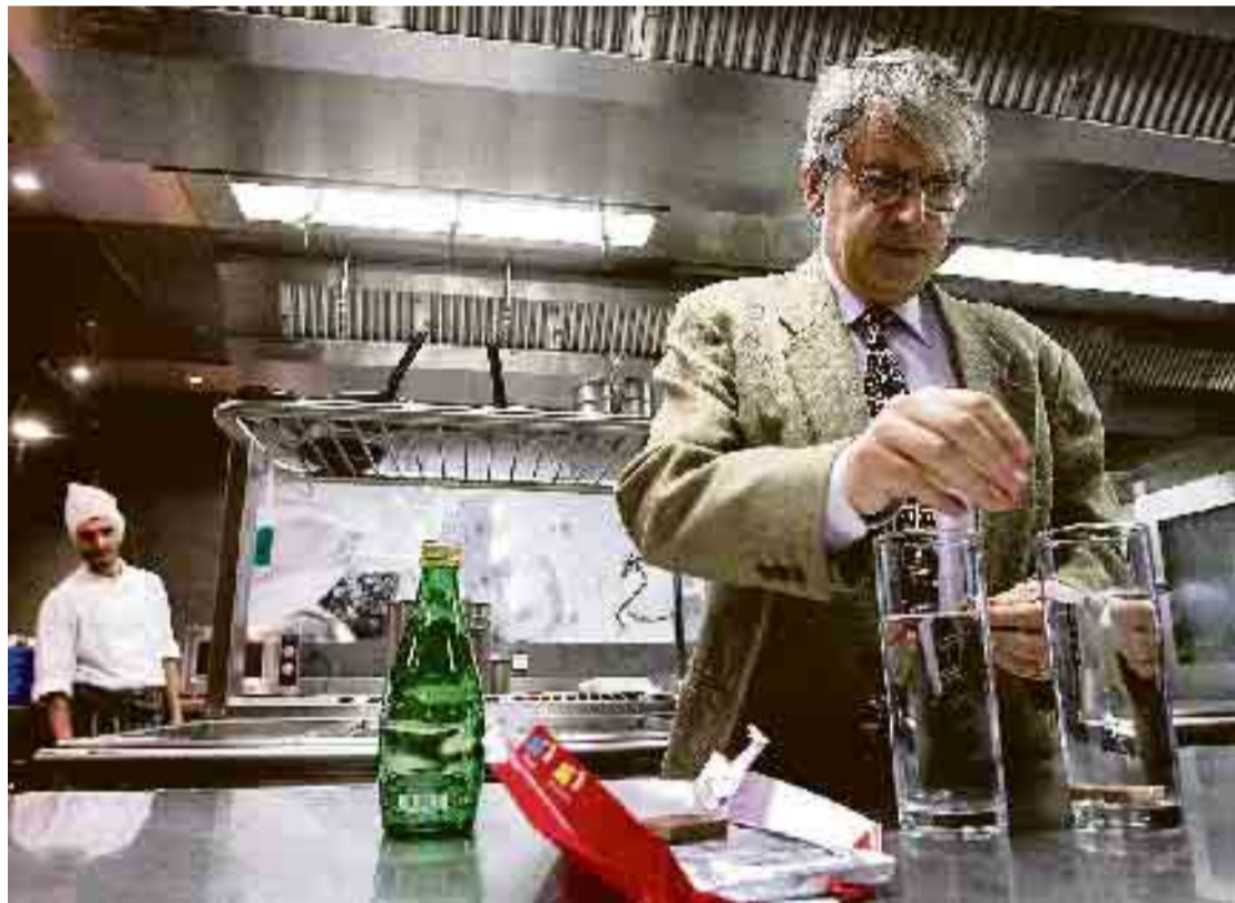
Mans realizó ayer una demostración científica con chocolate en el restaurante Yandiola.

Hay mucha más química entre los fogones de lo que imaginamos. No hace falta conocer estos procesos para cocinar, aunque, quien los conoce, puede mejorar platos tradicionales y generar nuevos platos. «Son los dos caminos actuales», señala el científico, que utiliza la cocina como fuente de ejemplos para divulgar la ciencia. Cada vez más