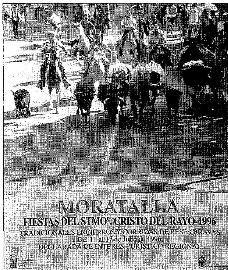
Imagen del cartel anunciador de las fiestas 1996.

Las fiestas culminarán el día 17 de julio con el disparo de tracas, una suelta de reses bravas, una pantalla de vídeo en la que aparecen recogidos todos los actos de las fiestas 1996, y una discoteca móvil con fiesta de la espuma, efectos especiales, disk-jockey, gogós y karaoke.