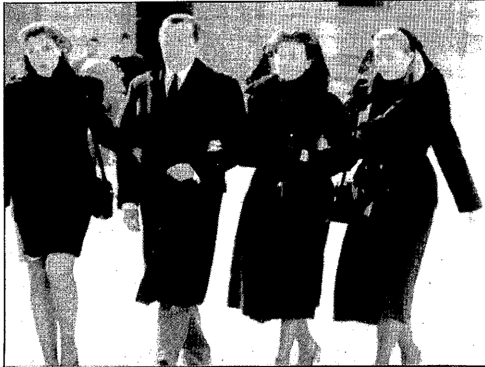
Pésame familiar Ayer pasaron a dar el pésame a la familia del Rey algunos de sus parientes, entre los que se encontraba Luis Alfonso de Borbón, los Reyes Simeón y Margarita de Bulgaria, los duques de Calabria, los Borbón-Dos Sicilias, los Baviera y la infanta Doña Alicia. En la imagen, los duques de Calabria, acompañados de sus hijas.