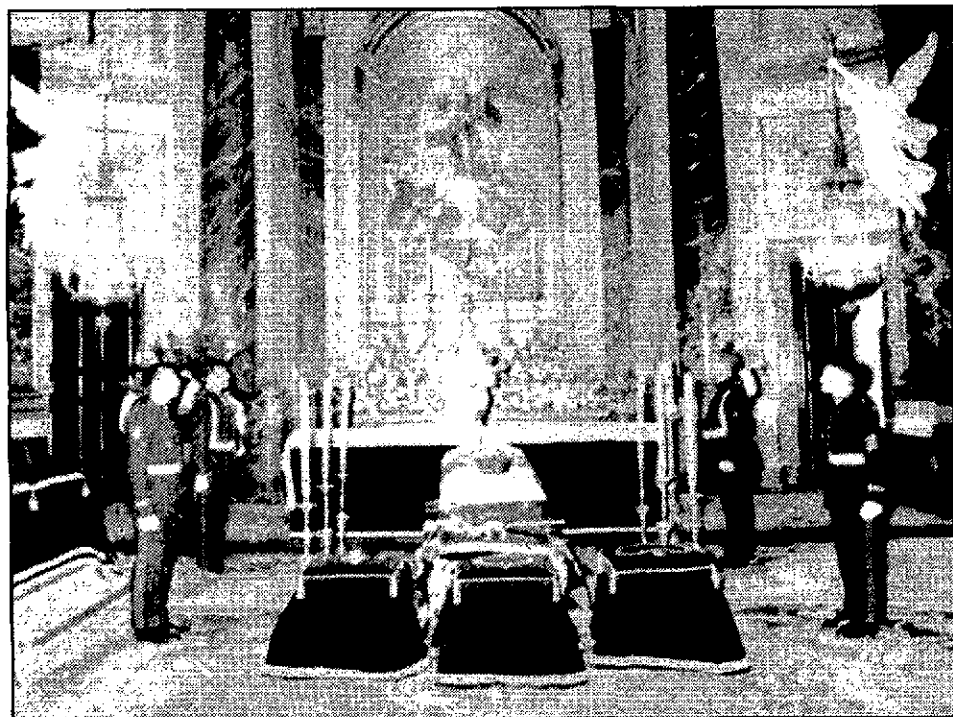
Condecoraciones Frente a los restos de Don Juan de Borbón, en el Palacio Real, fueron situadas algunas de sus condecoraciones, como el collar del Toisón de Carlos III, las grandes cruces del mérito militar, naval y aeronáutico y el bastón de mando de Capitán General de la Armada. La foto muestra la capilla ardiente del Conde de Barcelona./EFE

«Sin embargo, se alegró, como padre (del Rey Juan Carlos) y como español, al ver que la transición hacia la democracia era conducida de una manera madurada y responsable, al tiempo que España restablecía su continuidad histórica», afirmó el ex presidente francés./EFE