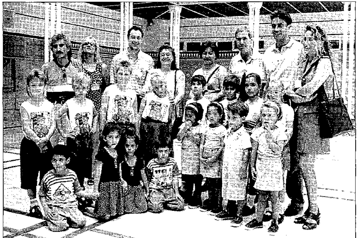
Las cuatro familias murcianas con cuatrillizos, ayer, en el Patio de las Comarcas de la Asamblea Regional.

Y una adivinanza criptica: un director general, no demasiado bien considerado entre los empresarios, por cierto, al parecer va a ser destituido en su cargo por un desliz impublicable muy parecido (aunque peor), al que motivó el cese de otro cierto director general en la época de los socialistas, sorprendido en su despacho de similar guisa, hecho del que todavía hoy se habla circunloquialmente entre el pudor, la risa y el escándalo. Y quien quiera entender, que entienda.