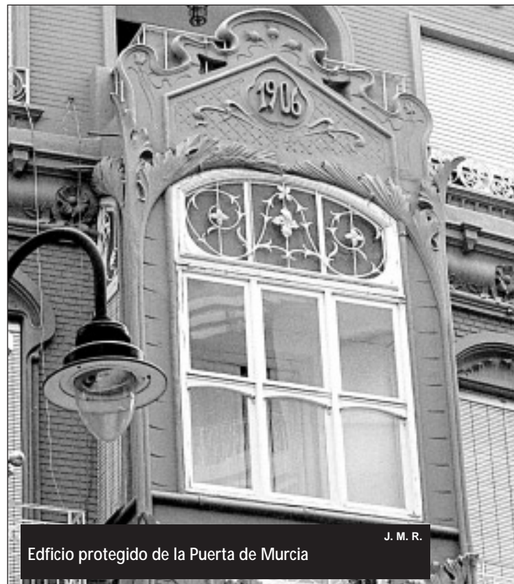
Edificio protegido de la Puerta de Murcia J. M. R.