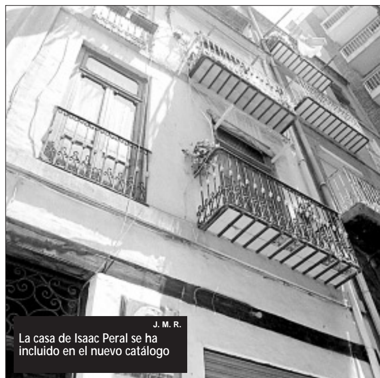
La casa de Isaac Peral se ha incluido en el nuevo catálogo J. M. R.

Rehabilitación en la calle San Diego. La sociedad Cartagena Casco Antiguo ha impulsado una serie de rehabilitaciones en edificios protegidos en la calle de San Diego. La propuesta de catálogo de edificios protegidos garantizará mejor su conservación. El lamento viene ahora porque algunos inmuebles, como el que estaba situado junto al Palacio de Aguirre, ha sido derribado. Con el nuevo documento, posiblemente no se hubiera convertido en solar. En la imagen, algunos de los inmuebles protegidos que se han acogido al plan de mejora de fachadas, financiado por la propiedad, la Administración regional y el ayuntamiento.