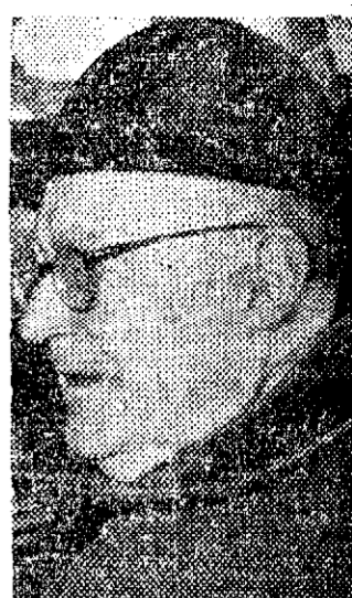
PLA Y DENIEL, español. Toledo, 86 años