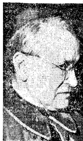
ARRIBA, español, Tarragona, 77 años