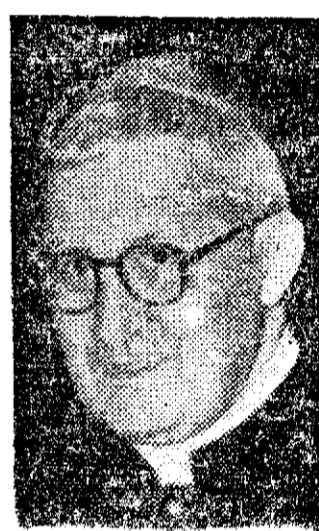
LAERONA, español, de Curia, 75 años