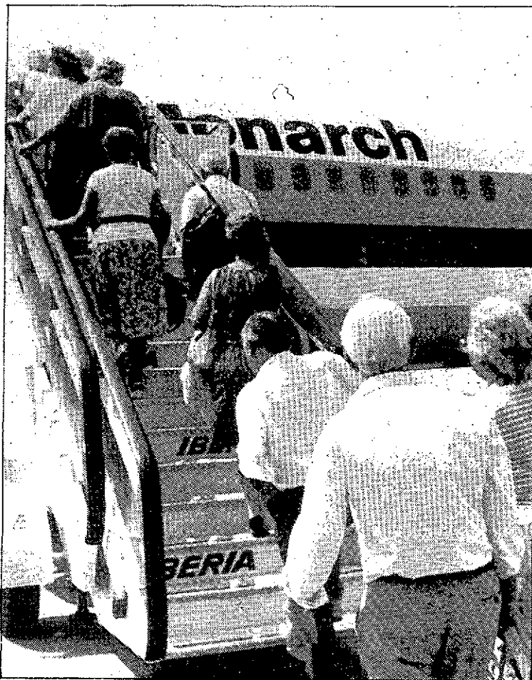
Un grupo de jubilados embarca en un avión.

El ministerio de Asuntos Sociales dio a conocer el pasado día 15 el presupuesto global para las vacaciones del Inerso 92-93, que será de 5.000 millones de pesetas. En total supondrán cinco millones de estancias, catorce mil de ellas de Murcia, 15.000 guías, 10.000 autocares, 30.000 plazas de transporte marítimo, 2.200 vuelos y se beneficiarán un total de 350.000 personas mayores.